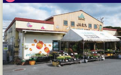
14 JA北九かつぱの里八幡店