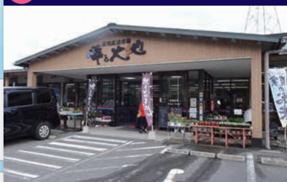
13 産地直送市場海と大地