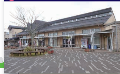
10 平尾台自然の郷ショップ