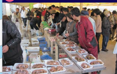
2 平松とれとれ朝市