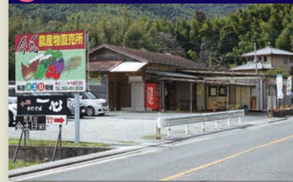
9 合馬農産物直売所