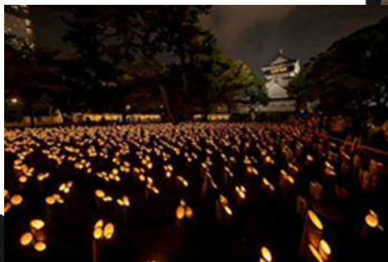
（第1回「小倉城竹あかり」の様子）