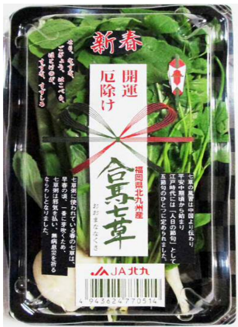
【合馬七草のパッケージ】