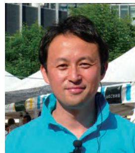
株式会社 代官山ワークス 代表取締役社長